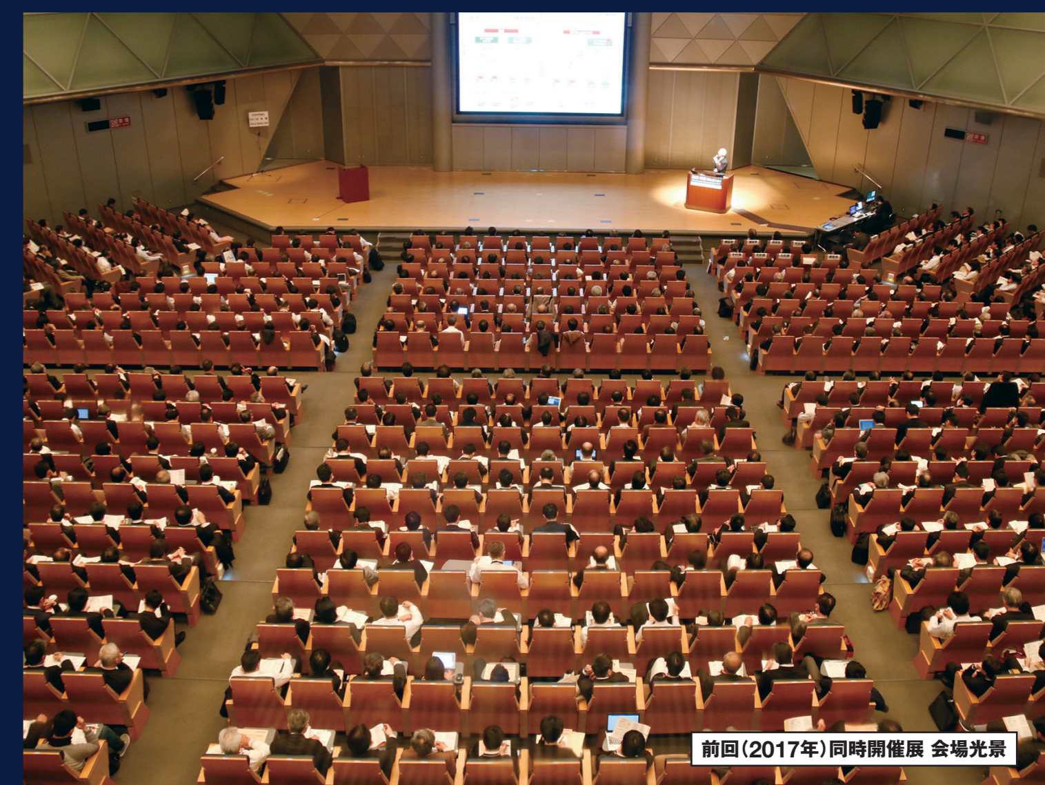
前回(2017年)同時開催展 会場光景