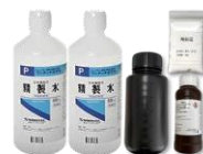
TS(濁度)センサー薬液セット