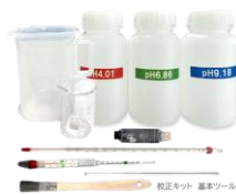
校正キット 基本ツールセット