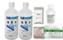
ORP(酸化還元)薬液セット