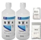
DO(溶存酸素)センサー薬液セット