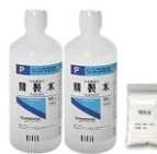
塩分センサー用セット