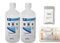
EC(導電率)センサー薬液セット