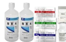
pH(水素イオン指数)センサー薬液セット